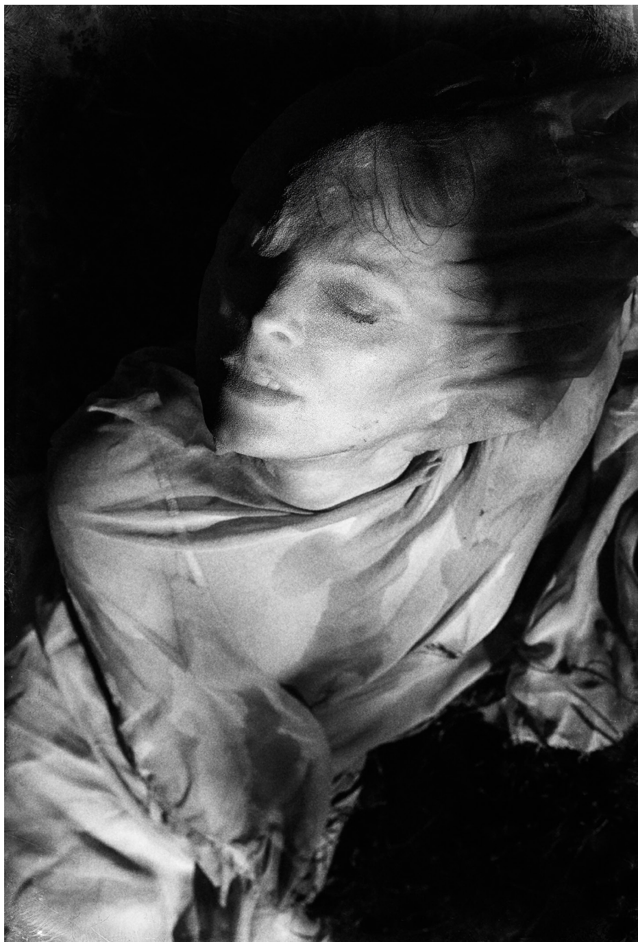
Uwięziona | 2015

„Urszula Nawrot jest niezwykle wrażliwym fotografem, robiącym nietuzinkowe, często intrygujące fotografie.... Mam wrażenie, że Pani Urszula ciągle poszukuje piękna, ale nie tego klasycznego, pospolitego, czystego. Szuka go w jakiejś innej postaci, nietypowej, oryginalnej.”