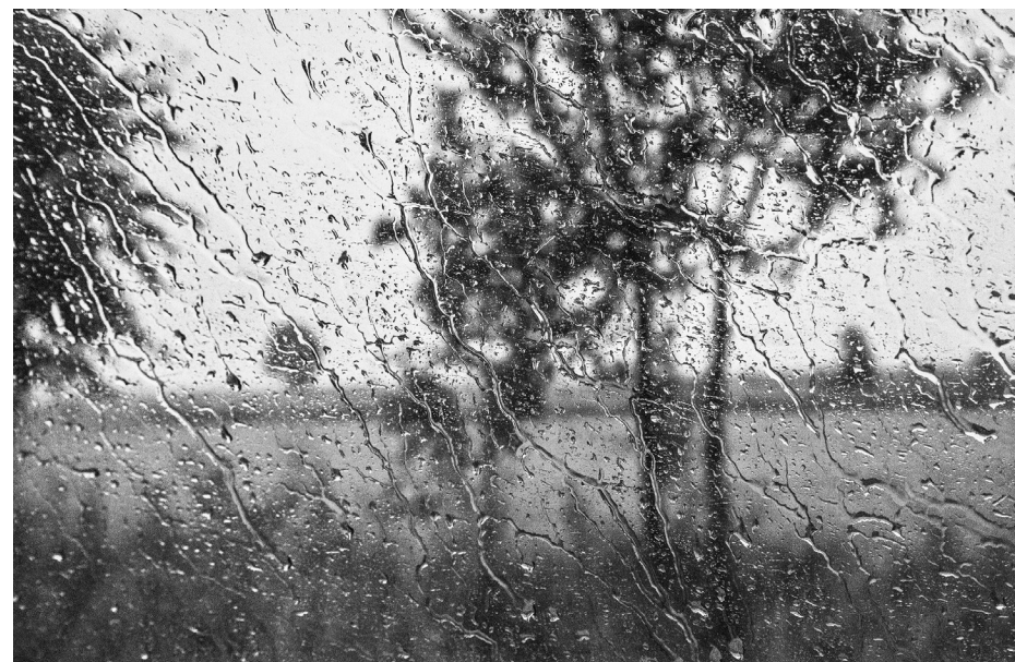
Nostalgia | 2013