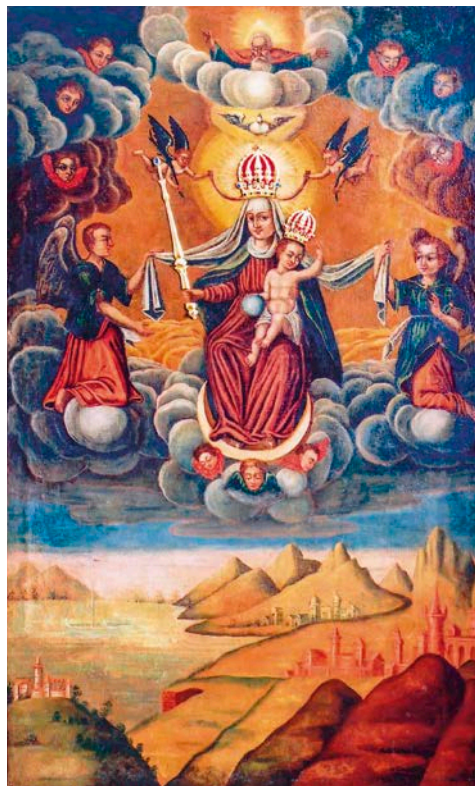
La imagen, milagrosamente famosa, de la Virgen María, Protectora de los Caminos Humanos

de la Emigración de los Sacerdotes de Cristo en Poznań. En 2007, el Centro estableció una colaboración con el santuario de Sokołów Małopolski, donde se conserva una imagen de Nuestra Señora Protectora de los Caminos Humanos – Patrona de los Emigrantes.