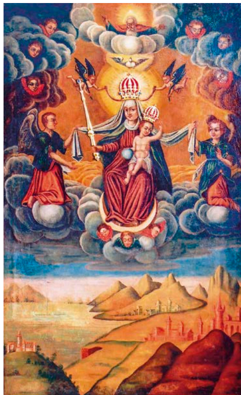
Чудотворная икона Богородицы Покровительницы путей человеческих

Христа в Познани. В 2007 г. Центр установил сотрудничество с санктуарием в городе Соколув-Малопольски, где находится икона Богородицы Покровительницы путей человеческих – покровительницы эмигрантов.